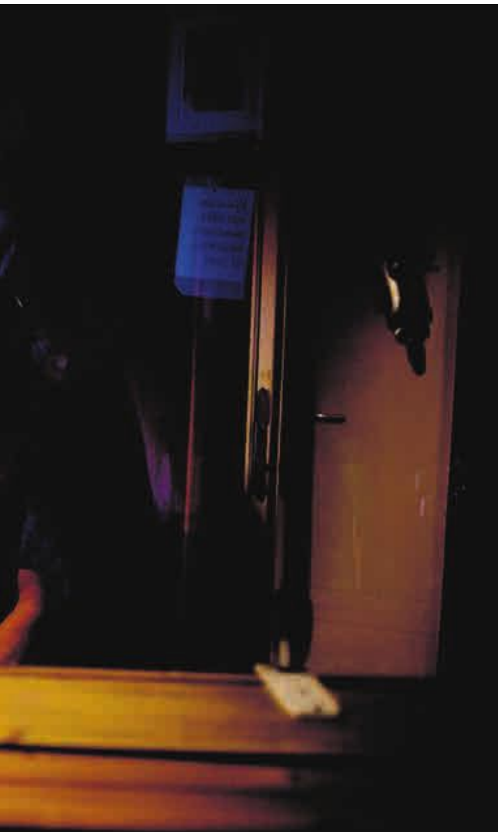
i Oslo. Boye måtte til New York for å finne økonomiprofessorer som tenker utenfor boksen.

Det er ikke vanskelig å forstå hvorfor økonomer er motvillige til å slippe til alternative perspektiver. En viktig grunn til at veien fra fagkunnskap til innflytelse er så kort for økonomer, er nettopp at det er relativt liten faglig uenighet om sentrale spørsmål.