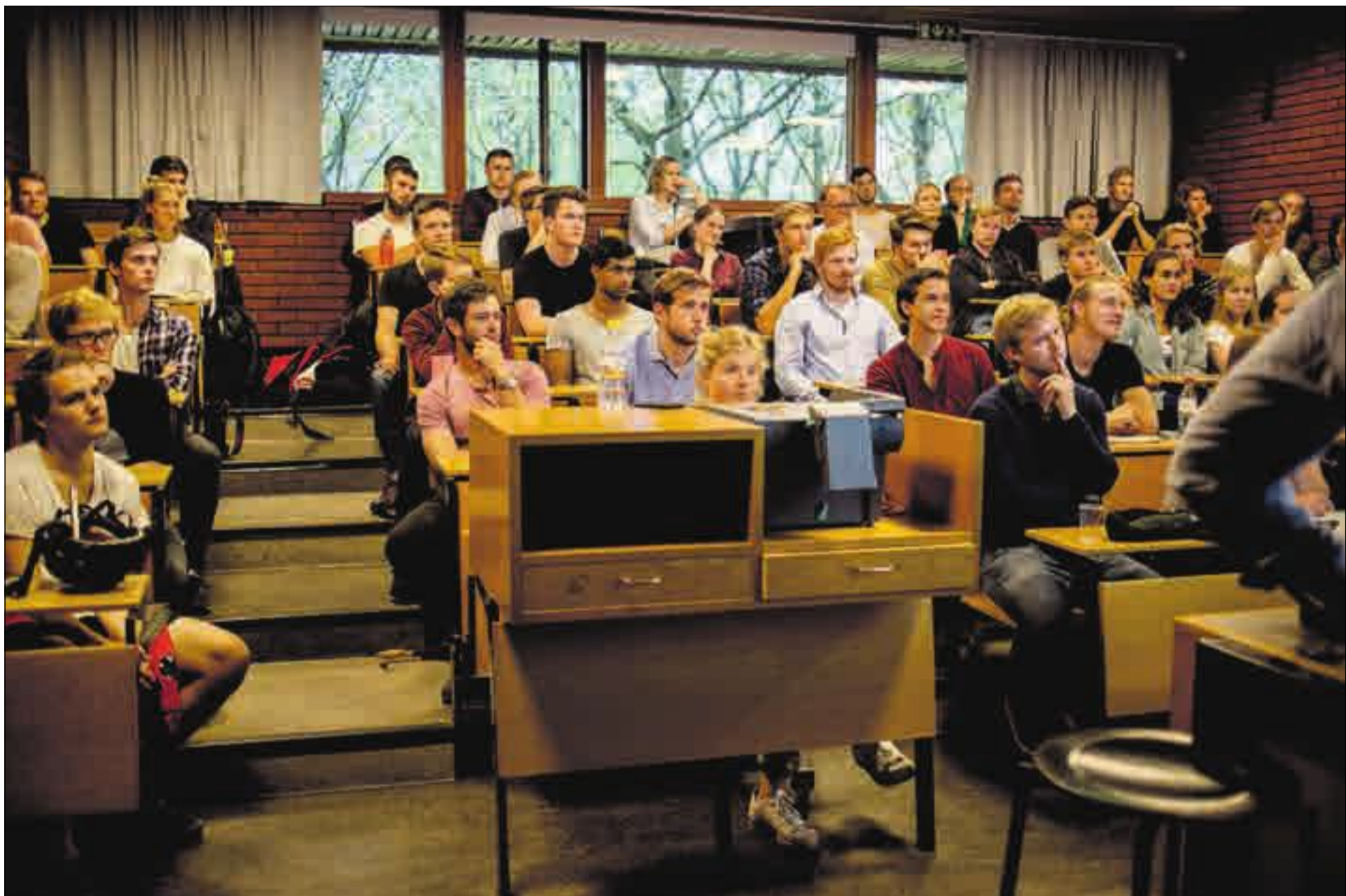
AUDITORIUM 4, KL. 16.15: Nettverket Rethinking Economics Norge diskuterer hvordan de skal gå fram for å endre pensum på økonomiutdannelsen i Norge. Grappa er del av et internasjonalt studentopprør mot det faglige enfoldet de opplever i utdanningen.