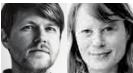
Av Lars U. L. Vegstein (tekst) og Anniken C. Mohr (foto)

BRUDD: På Universitetet i Oslo foregår en kamp om hva slags økonomer Norge skal ha i framtida.